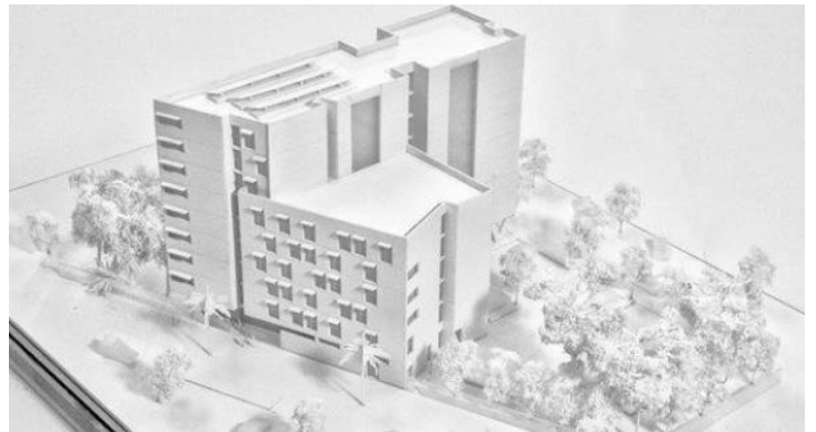
Nice : résidence sociale de 150 logements