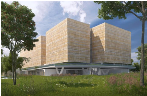
Saint Martin d'Hères (38) : Archives départementales de l'Isère : Réalisation du clos-couvert / gros œuvre par Cuynat Construction du bâtiment, imaginé par CR&ON Architectes