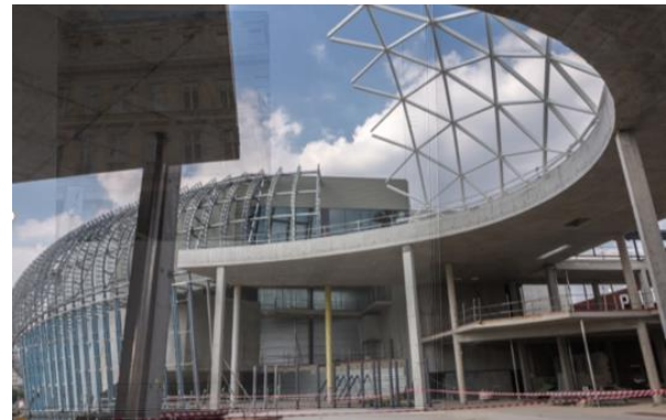
Vélizy (92) : Construction de 22 000m 2 dont un cinéma de 18 salles sous bulle en verre et 19 restaurants