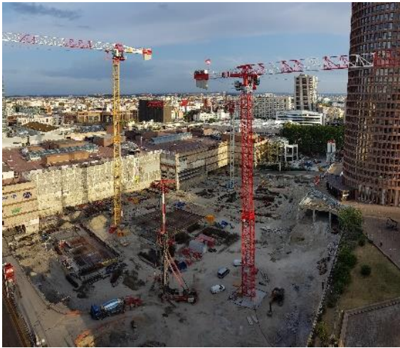
Lyon : rénovation Centre Commercial de La Part Dieu / 32 000 m 2 supplémentaires