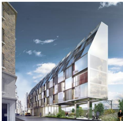
Paris : Résidence étudiante et foyer rue Castagnary dans le 15 ème en entreprise générale – 16M€ /224 Chambres