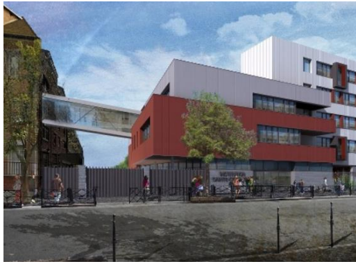
Asnières (92) : Extension du Centre Scolaire Ste Geneviève pour l'OGEC