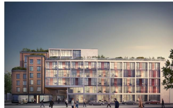
Saint Ouen (93) : Construction d'un hôtel (149 chambres), d'une résidence étudiantes (150 logements), de 4 000 m 2 de bureaux et 87 logements (18M€)