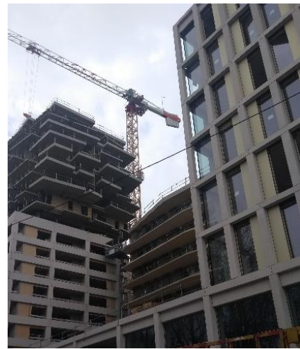
Lyon : Modernisation et réhabilitation de Logements Sociaux