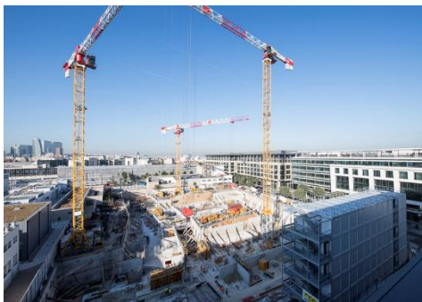
Courbevoie (92) : en Entreprise Générale – Construction de Bureaux en neuf – Phase G.O