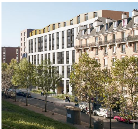
Paris : Conception réalisation d'une résidence sociale dans le 13eme Paris chantier Senghor – 10M€