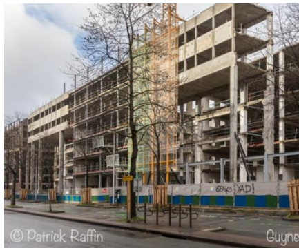
Issy les Moulineaux (92) : Restructuration lourde deux bâtiments pour Unibail - Futur siège de Nestlé.