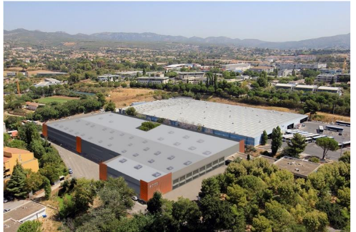
Marseille : Restructuration des Entrepôts (20 000 m 2 ) d'entretien et remisage de bus de la Régie des Transports Marseillais en EG.12 M€