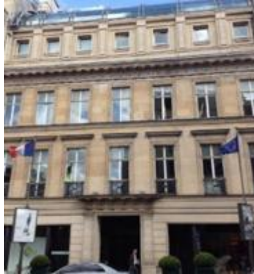
Paris : Avenue Matignon- Réhabilitation lourde en E.G pour notre client AXA