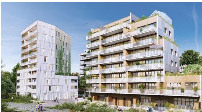
Lille : construction de 3 immeubles R+7 à R+9 pour PROJECTIM - îlot