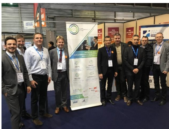
L'équipe 1G4.0 présente au salon BE4.0 Mulhouse 2018

Digitalisation relation client-production, chainage et usine numérique : CAO, FAO, ERP/capteur-base de données, conception innovante, fabrication additive, prototypes fonctionnels, supply chain management, lean manufacturing, gestion des flux, process, modélisation, simulation numérique multiphysique, robotique, cobotique, automatisation, électronique embarquée, instrumentation, capteurs, application mobile, contrôle et commande, mobilité électrique, fouille de données, bâtiment connecté, efficacité énergétique, internet des objets