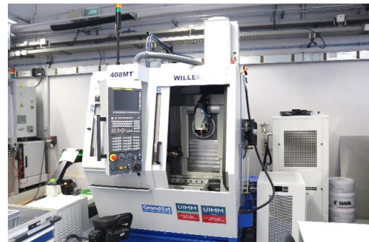
Centre d'usinage (Plateforme mécanique)

La spécialité mécatronique : L'ingénieur en mécatronique intervient dans le développement de systèmes automatisés qui mettent en œuvre des techniques issues de différentes disciplines : mécanique, électronique, informatique et automatique. Il intervient tout au long du cycle de vie des produits industriels : recherche et développement, avant-projet, développement, industrialisation, exploitation.