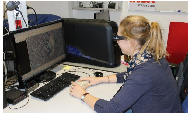
Station de restitution 3D (plateforme topographie)