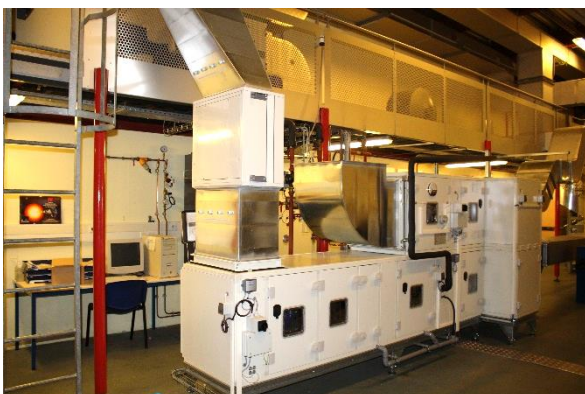
Structure de la plateforme aéroulque et rénovation centrale traitement d'air (plateforme Climatherm)

La spécialité génie climatique et énergétique forme des ingénieurs climaticiens pour le secteur du bâtiment et de l'industrie, capables de concevoir des systèmes climatiques économes en énergie et à faible impact environnemental, d'assurer le suivi de leur réalisation et d'en piloter la gestion et la maintenance. Ces systèmes permettent la maîtrise de climats artificiels dans les bâtiments à usage d'habitation, tertiaire ou industriel.