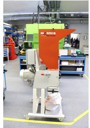
Broyeur recyclabilité (plateforme mécanique)

La spécialité génie électrique : les compétences acquises dans la spécialité génie électrique vont couvrir les domaines techniques tels que l'informatique, l'automatique, l'électronique de puissance, l'électrotechnique. Les problèmes d'économie d'énergie et la mise en œuvre des énergies renouvelables sont aussi étudiés. Trois parcours sont proposés en dernière année :