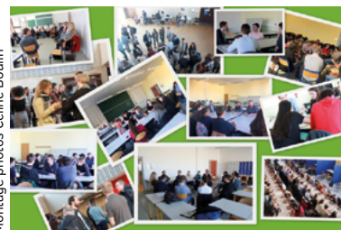
Montage photos Céline Boulin

Journée énergie le 19 mars 2020 à l'INSA Strasbourg